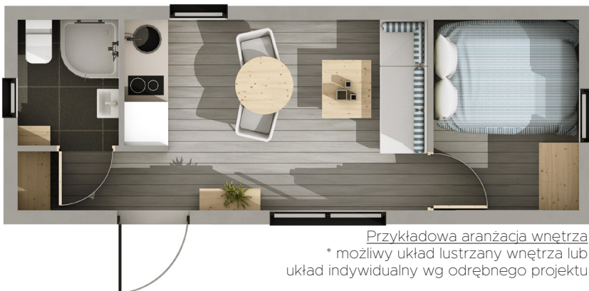
Przykładowa aranżacja wnętrza * możliwy układ lustrzany wnętrza lub układ indywidualny wg odrębnego projektu

Dom Meveline to doskonała alternatywa dla niewielkiego domu budowanego tradycyjną metodą, domków drewnianych, oraz tzw. domków holenderskich. Dom jest dostarczany na miejsce gotowy i posadawiany praktycznie na gruncie, bez fundamentów. Dzięki wyposażeniu w demontowane koła, może być ustawiony w niemal dowolnym miejscu. Jego mobilność ma duże znaczenie w przypadku posadowienia jako obiekt tymczasowy. Jednocześnie, po umieszczeniu na docelowym miejscu, możliwe jest skuteczne zamaskowanie funkcji mobilności i estetyczne wkomponowanie w otoczenie.